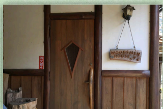
入口(ソロハウス1F右側)